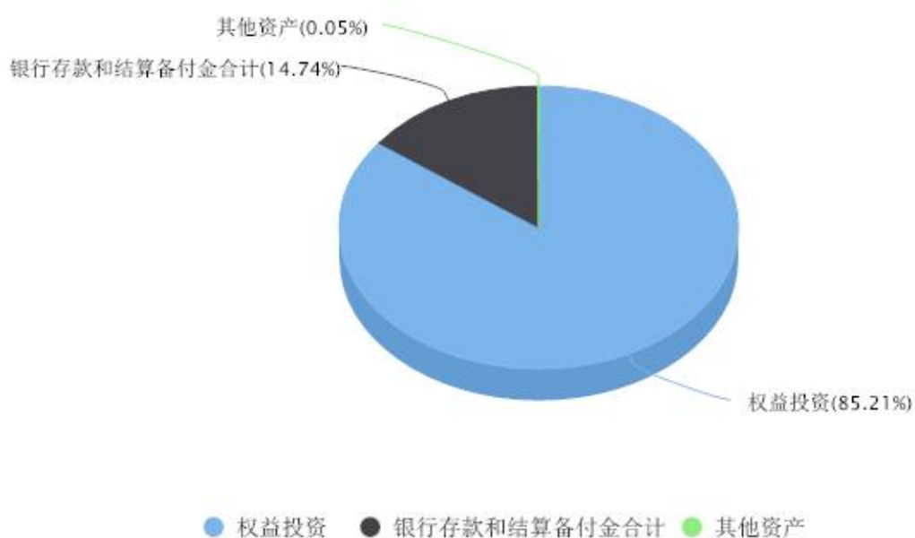
投资组合资产配置图表 数据截止日期:2023年09月30日