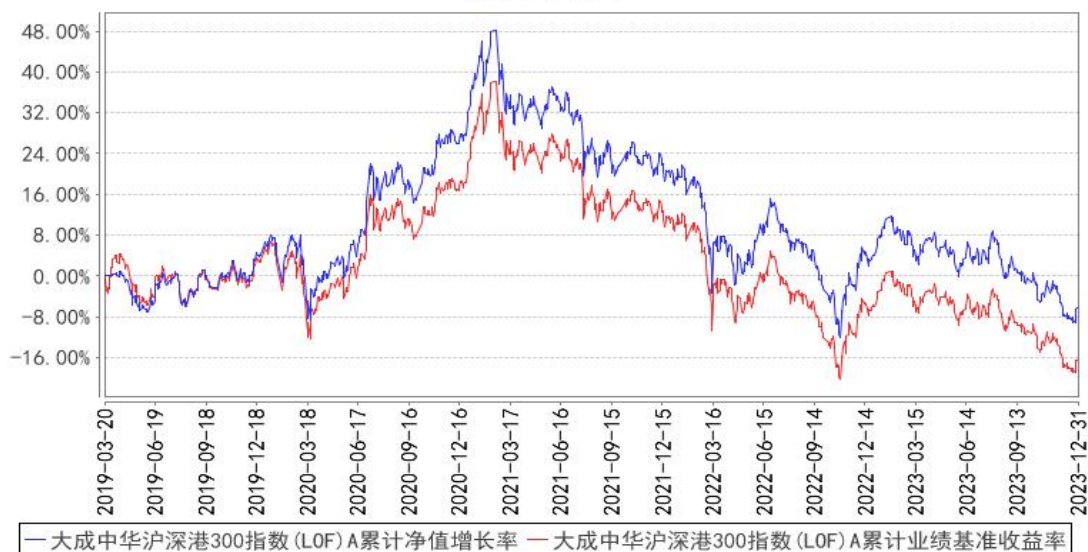
大成中华沪深港300指数(LOF)A累计净值增长率与同期业绩比较基准收益率的历史走势对比图