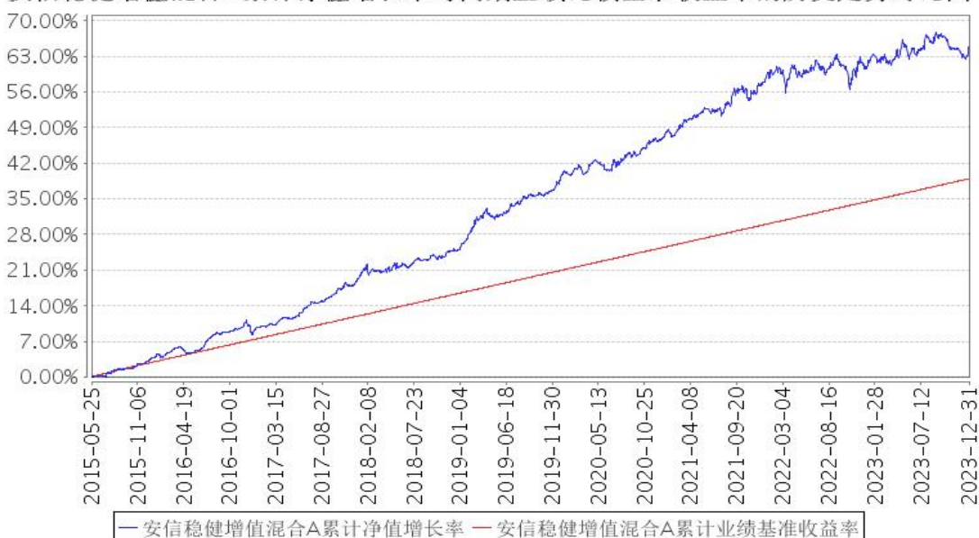
安信稳健增值混合A累计净值增长率与同期业绩比较基准收益率的历史走势对比图