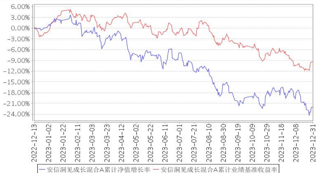
安信洞见成长混合A累计净值增长率与同期业绩比较基准收益率的历史走势对比图