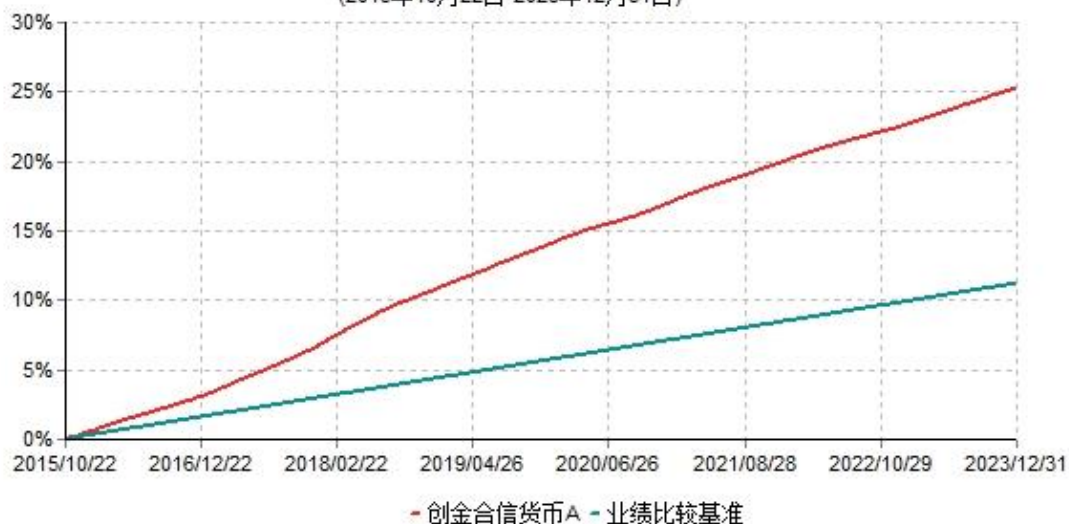
创金合货币A累计净值收益率与业绩比较基准收益率历史走势对比图 (2015年10月22日-2023年12月31日)