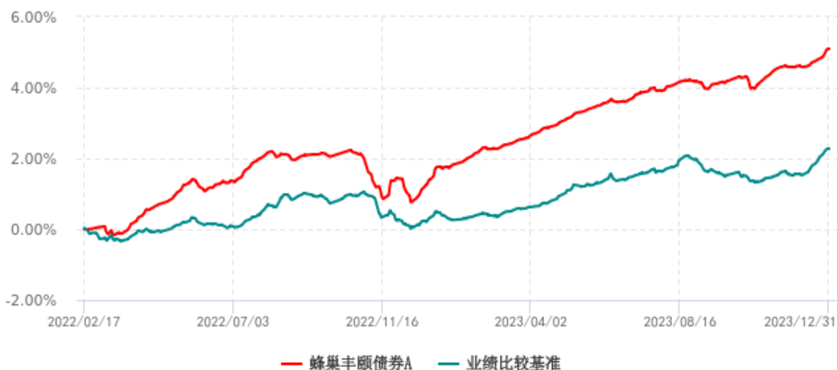
蜂巢丰颐债券A累计净值增长率与业绩比较基准收益率历史走势对比图 (2022年02月17日-2023年12月31日)