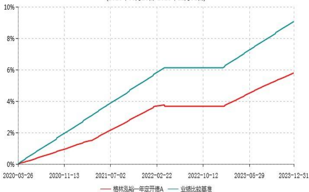
格林泓裕一年定开债A累计净值增长率与业绩比较基准收益率历史走势对比图 (2020年03月26日-2023年12月31日)

注：根据《格林泓裕一年定期开放债券型证券投资基金基金合同》约定，经向中国证监会备案，基金管理人于 2022 年 3 月 29 日发布《关于格林泓裕一年定期开放债券型证券投资基金第二个开放期到期后暂停运作、不进入下一封闭期的公告》，本基金于 2022 年 3 月 29 日起暂停运作。经与基金托管人协商一致，并报中国证监会备案，基金管理人于 2023 年 1 月 13 日发布《关于格林泓裕一年定期开放债券型证券投资基金恢复运作并开放申购、赎回及转换业务的公告》，本基金自 2023 年 1 月 13 日起恢复运作并开放申购、赎回及转换业务。份额净值增长率和业绩比较基准收益率均按实际存续期计算。