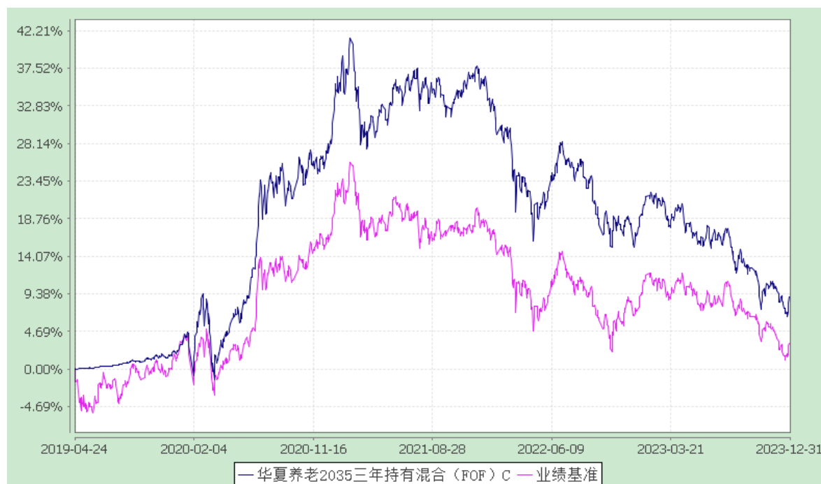
华夏养老 2035 三年持有混合（FOF）Y：