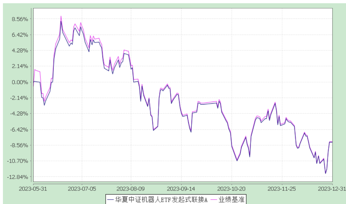
华夏中证机器人ETF发起式联接C: