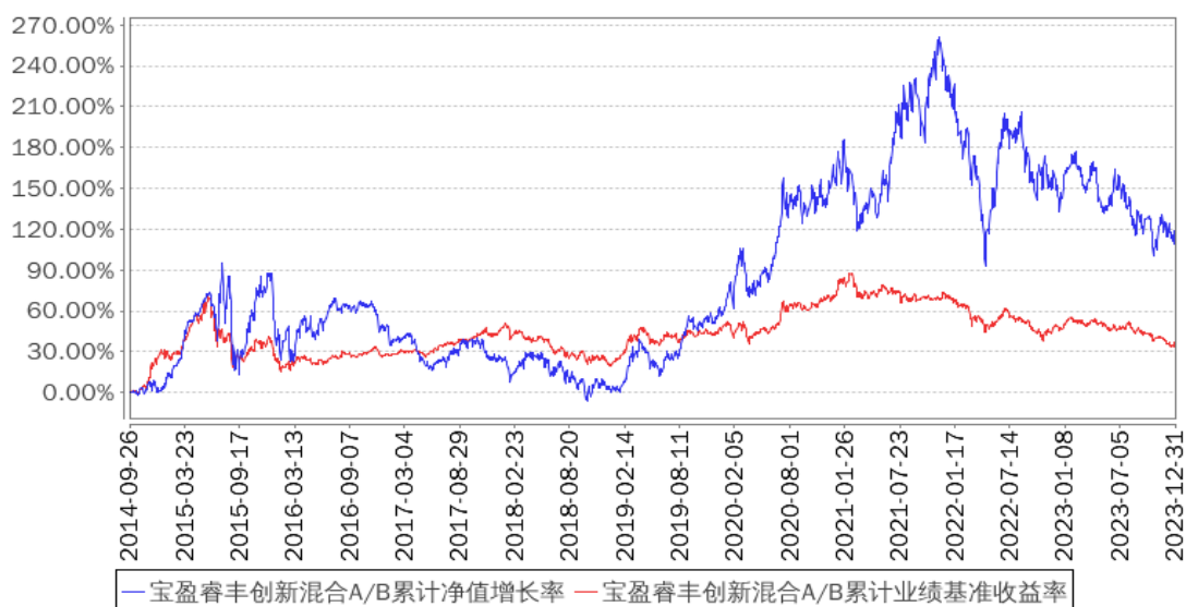
宝盈睿丰创新混合A/B累计净值增长率与同期业绩比较基准收益率的历史走势对比图