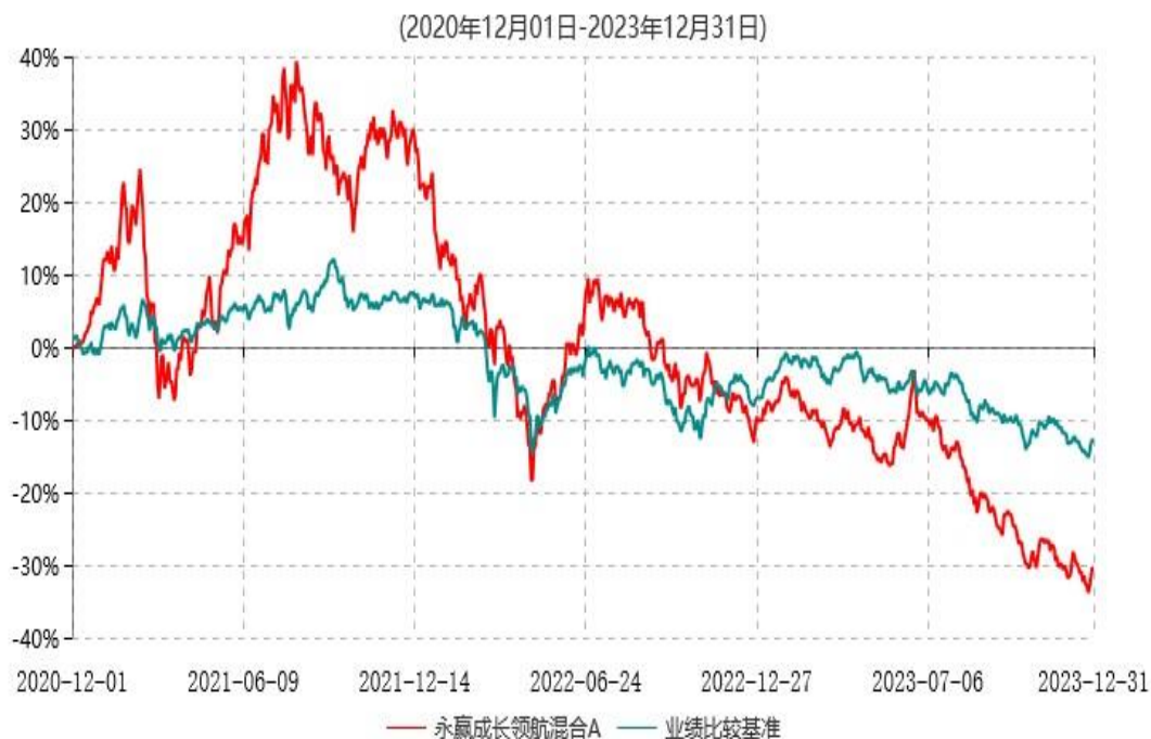
永赢成长领航混合A累计净值增长率与业绩比较基准收益率历史走势对比图