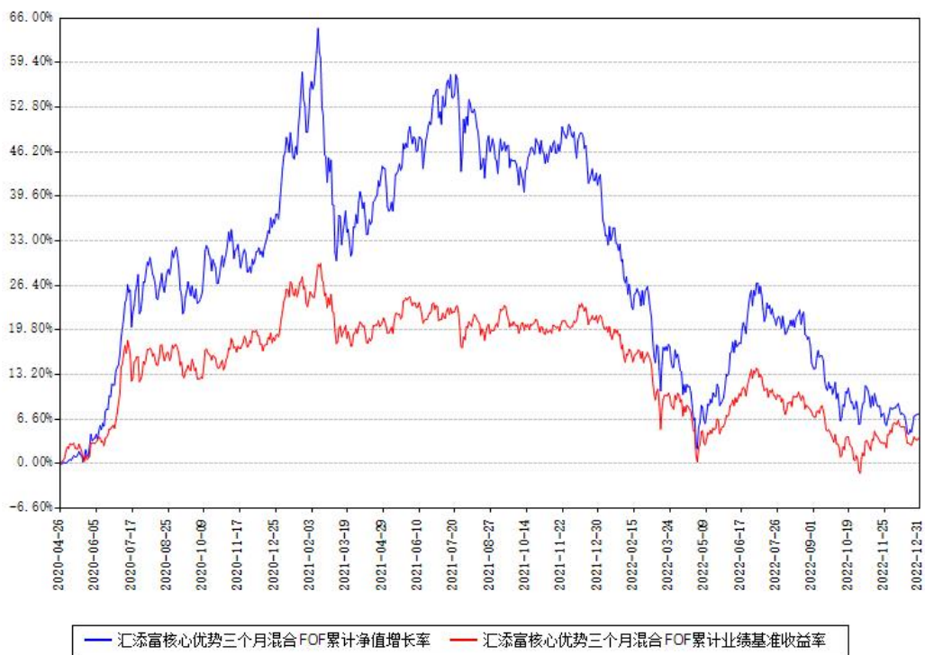
汇添富核心优势三个月混合FOF累计净值增长率与同期业绩基准收益率对比图