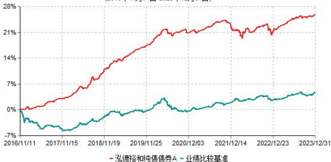
泓德裕和纯债债券A累计净值增长率与业绩比较基准收益率历史走势对比图 (2016年11月11日-2023年12月31日)