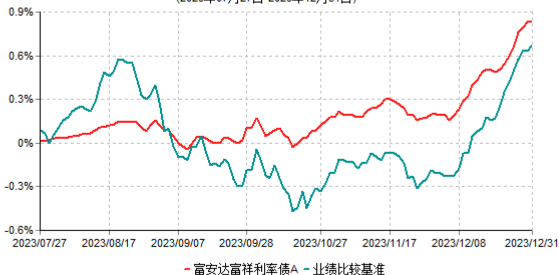
富安达富祥利率债A累计净值增长率与业绩比较基准收益率历史走势对比图 (2023年07月27日-2023年12月31日)