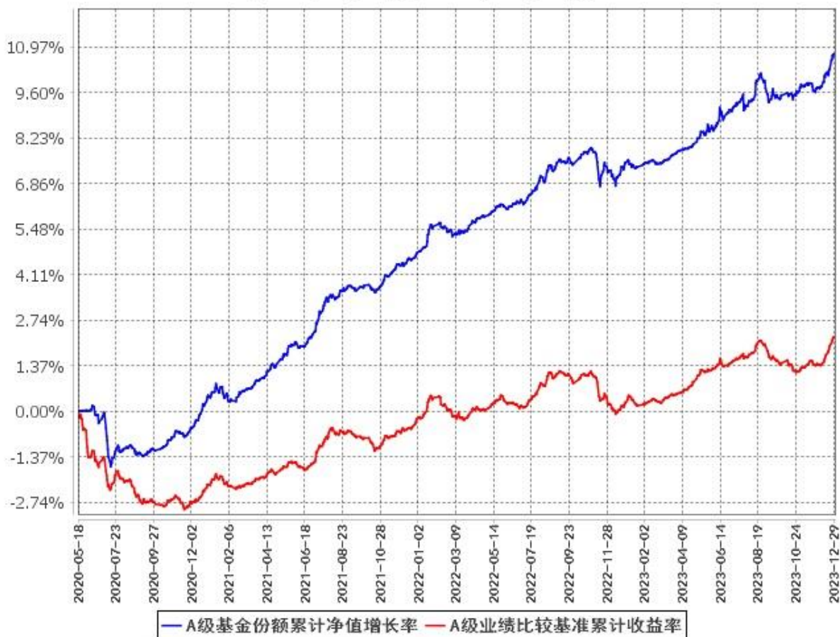
A级基金份额累计净值增长率与同期业绩比较基准收益率的历史走势对比图 (2020年5月18日至2023年12月31日)