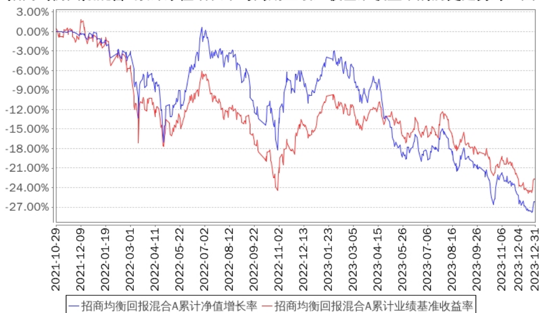
招商均衡回报混合A累计净值增长率与同期业绩比较基准收益率的历史走势对比图