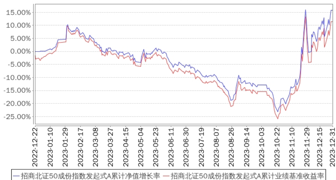
招商北证50成份指数发起式A累计净值增长率与同期业绩比较基准收益率的历史走势对比图