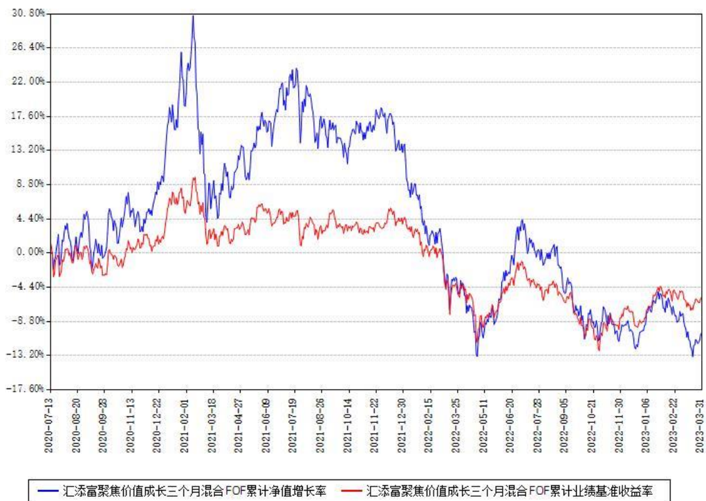
汇添富聚焦价值成长三个月混合FOF累计净值增长率与同期业绩基准收益率对比图