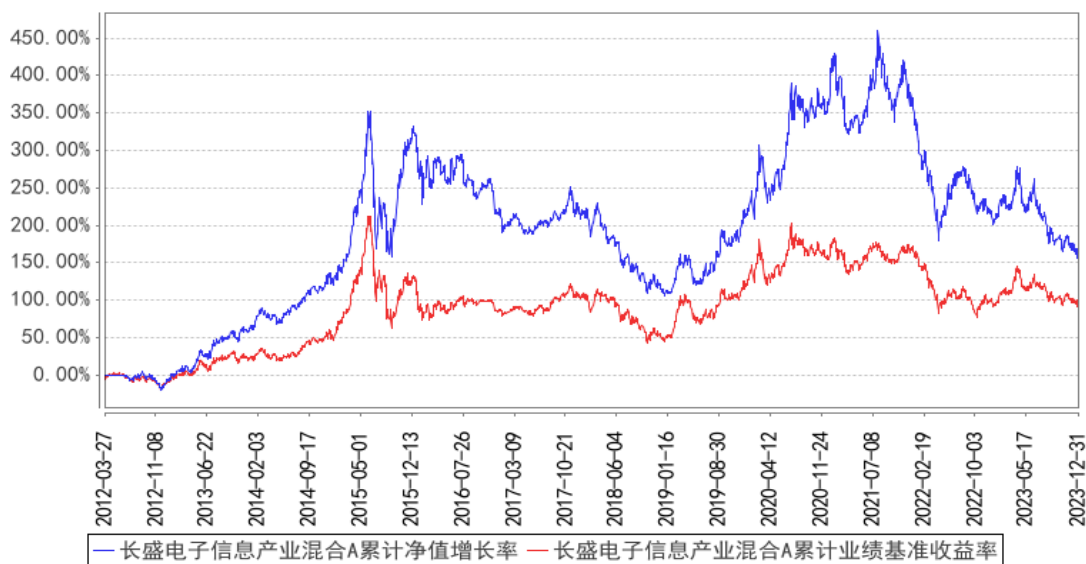
长盛电子信息产业混合A累计净值增长率与同期业绩比较基准收益率的历史走势对比图