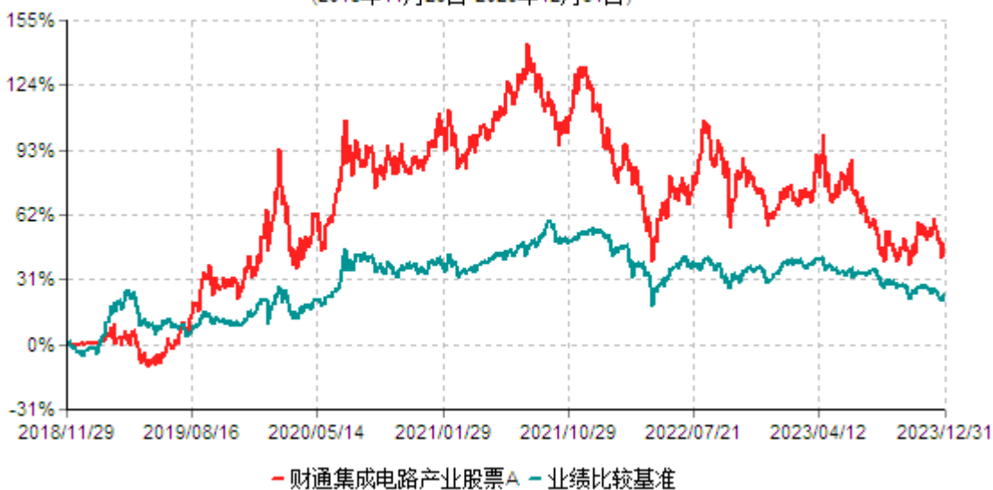
财通集成电路产业股票A累计净值增长率与业绩比较基准收益率历史走势对比图 (2018年11月29日-2023年12月31日)