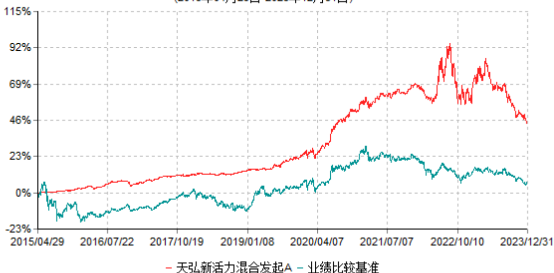
天弘新活力混合发起A累计净值增长率与业绩比较基准收益率历史走势对比图 (2015年04月29日-2023年12月31日)