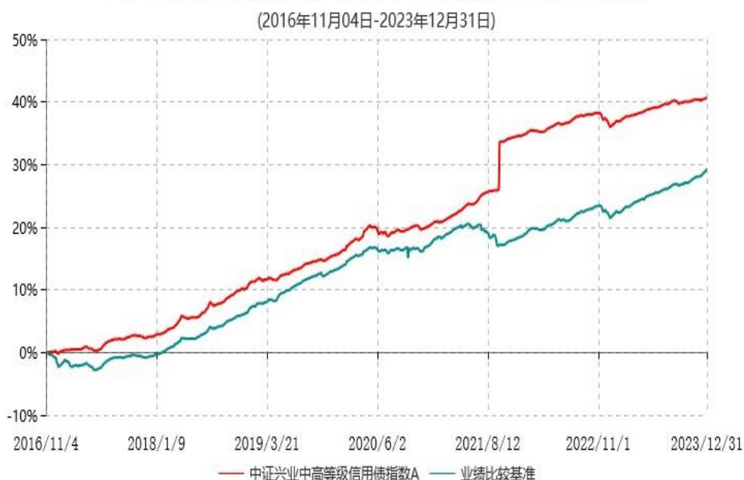
中证兴业中高等级信用债指数A累计净值增长率与业绩比较基准收益率历史走势对比图