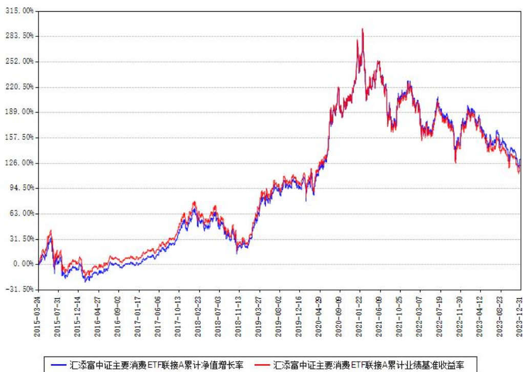
汇添富中证主要消费ETF联接A累计净值增长率与同期业绩基准收益率对比图