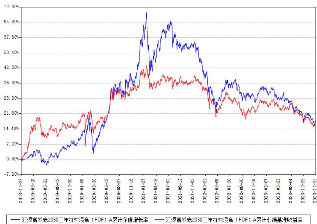
汇添富养老2030三年持有混合（FOF）A累计净值增长率与同期业绩比较基准收益率对比图