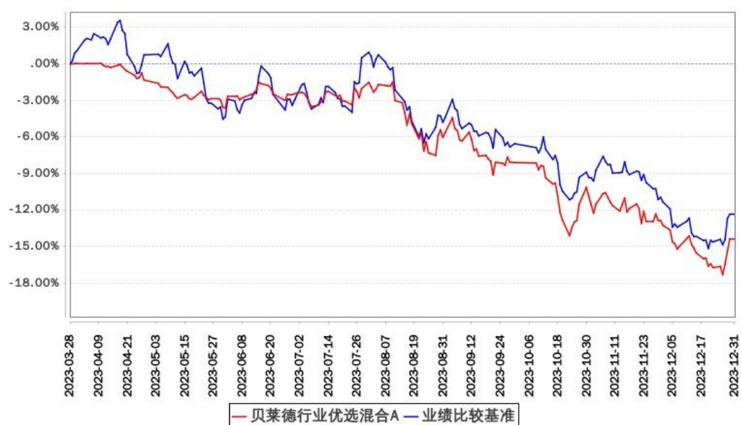
贝莱德行业优选混合A累计净值增长率与同期业绩比较基准收益率的历史走势对比图