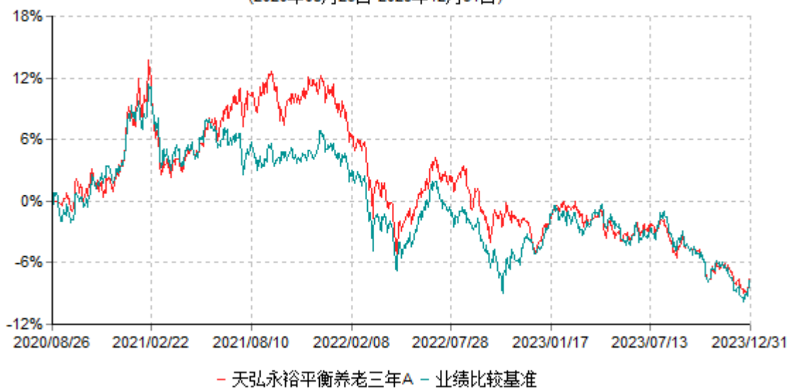
天弘永裕平衡养老三年A累计净值增长率与业绩比较基准收益率历史走势对比图 (2020年08月26日-2023年12月31日)