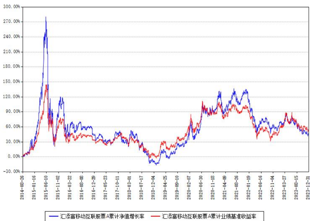
汇添富移动互联股票A累计净值增长率与同期业绩比较基准收益率对比图