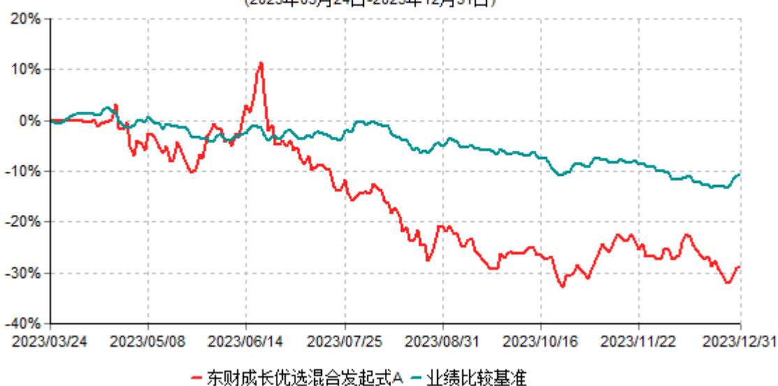
东财成长优选混合发起式A累计净值增长率与业绩比较基准收益率历史走势对比图 (2023年03月24日-2023年12月31日)