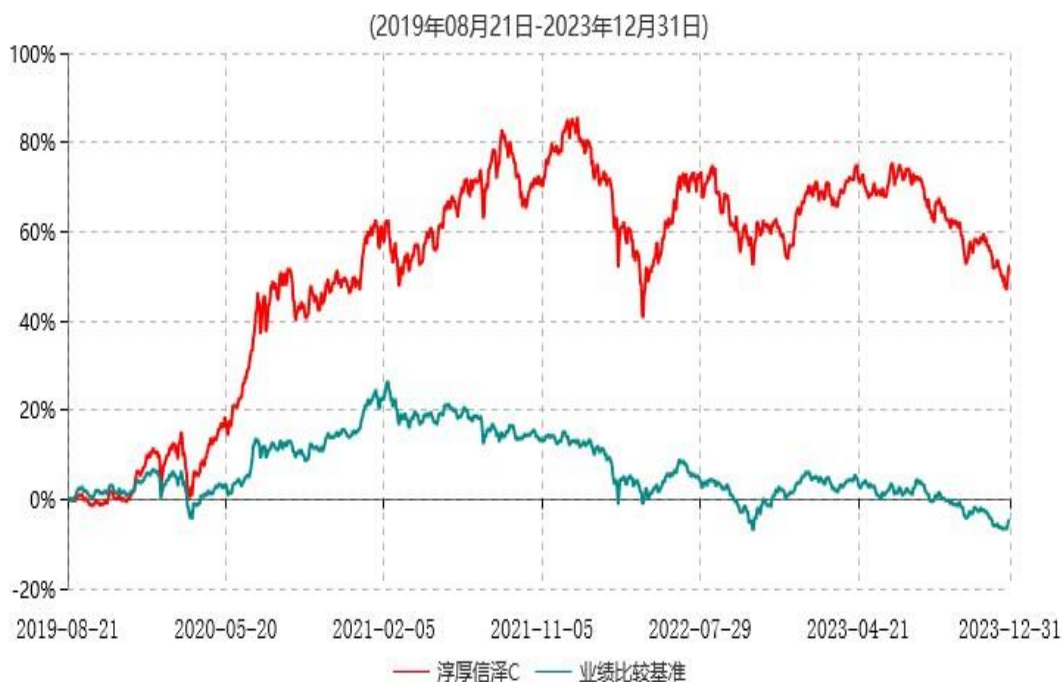
淳厚信泽C累计净值增长率与业绩比较基准收益率历史走势对比图

注：本基金基金合同生效日为 2019 年 8 月 21 日。按基金合同约定，本基金自基金合同生效起 6 个月内为建仓期。建仓期结束时本基金的各项投资比例均符合基金合同约定。