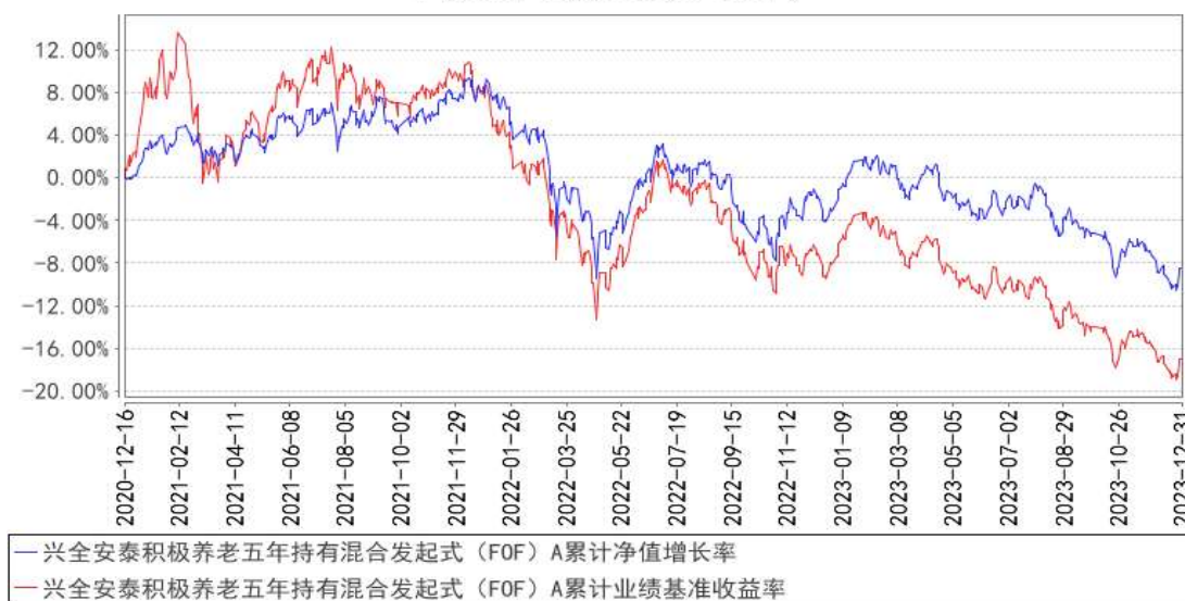
兴全安泰积极养老五年持有混合发起式（FOF）A 累计净值增长率与同期业绩比较基准收益率的历史走势对比图