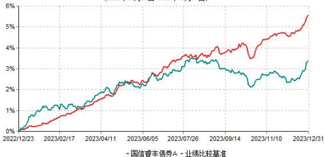
国信睿丰债券A累计净值增长率与业绩比较基准收益率历史走势对比图 (2022年12月23日-2023年12月31日)