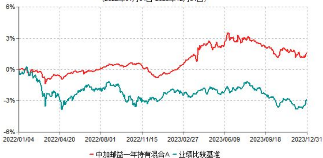
中加邮益一年持有混合A累计净值增长率与业绩比较基准收益率历史走势对比图 (2022年01月04日-2023年12月31日)

2、自基金合同生效以来基金累计净值增长率变动及其与同期业绩比较基准收益率变动的比较