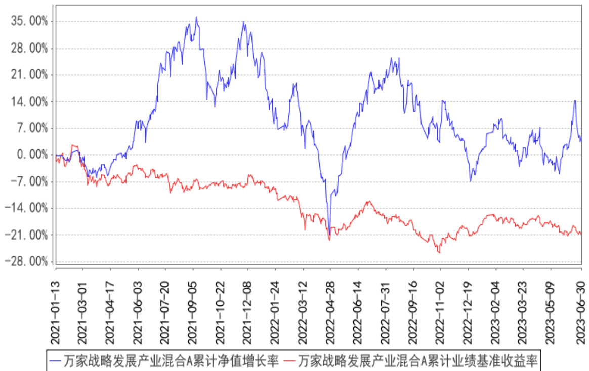
万家战略发展产业混合A累计净值增长率与同期业绩比较基准收益率的历史走势对比图

(二) 自基金合同生效以来基金累计净值收益率变动及其与同期业绩比较基准收益率变动的比较