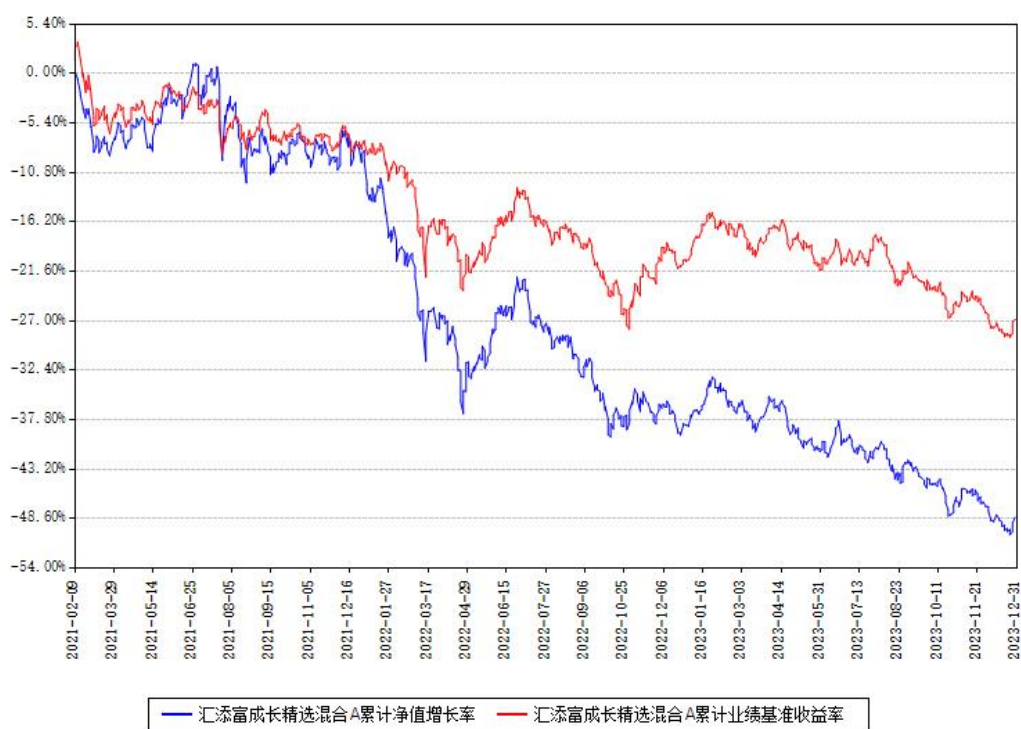
汇添富成长精选混合A累计净值增长率与同期业绩基准收益率对比图