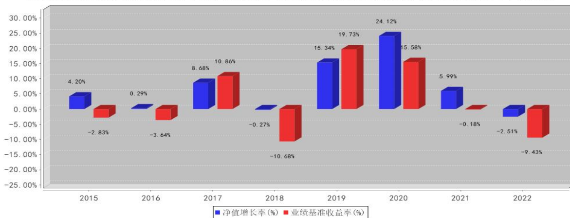
国联安睿祺灵活配置混合基金每年净值增长率与同期业绩比较基准收益率的对比图2022年12月31日