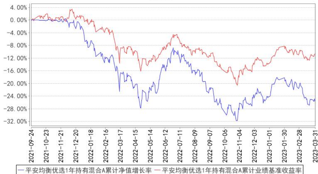
平安均衡优选1年持有混合A累计净值增长率与同期业绩比较基准收益率的历史走势对比图