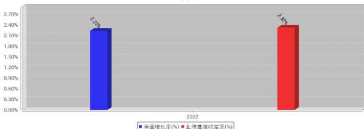
工银瑞兴一年定开纯债债券发起式基金每年净值增长率与同期业绩比较基准收益率的对比图（2022年12月31日）

注：1、本基金基金合同于 2022 年 2 月 11 日生效。合同生效当年不满完整自然年度的，按实际期限计算净值增长率。