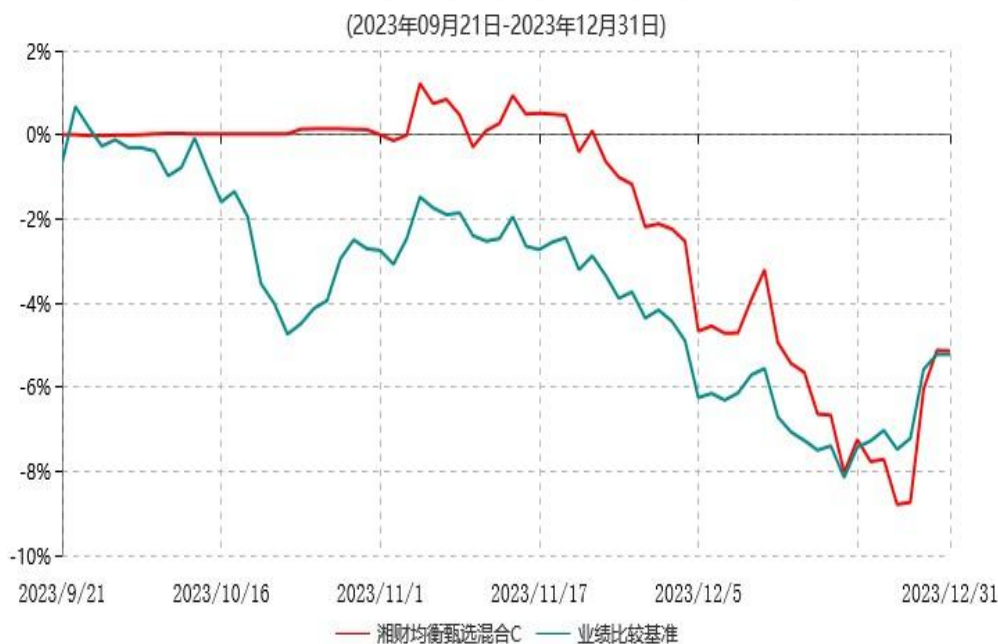
湘财均衡甄选混合C累计净值增长率与业绩比较基准收益率历史走势对比图