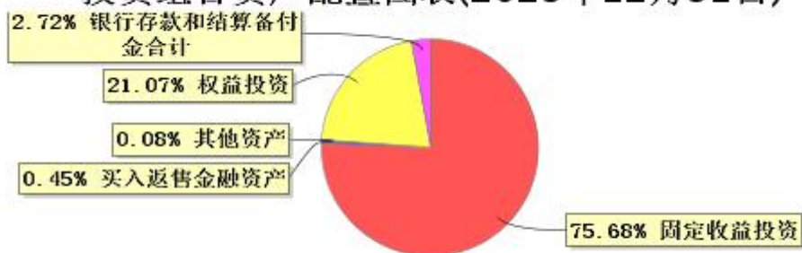
投资组合资产配置图表(2023年12月31日)

● 固定收益投资 ● 买入返售金融资产 ● 其他资产 ● 权益投资 ● 银行存款和结算备付金合计