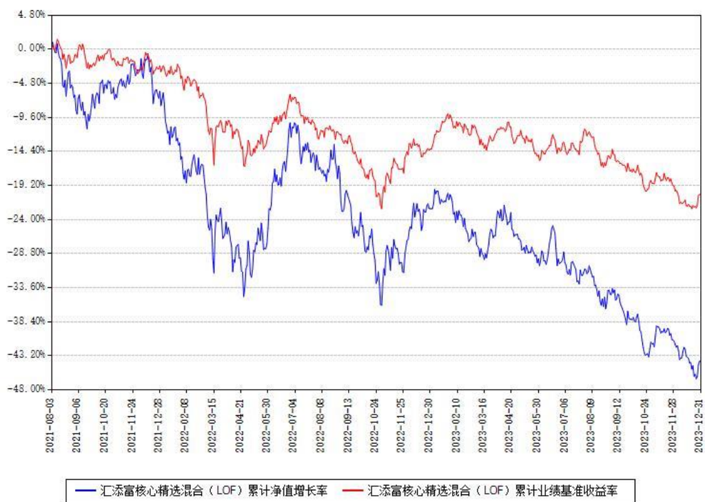
汇添富核心精选混合（LOF）累计净值增长率与同期业绩基准收益率对比图