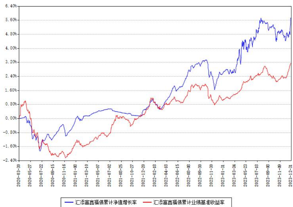
汇添富鑫福债累计净值增长率与同期业绩基准收益率对比图