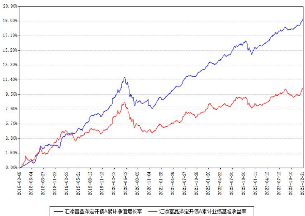
汇添富鑫泽定开债A累计净值增长率与同期业绩基准收益率对比图