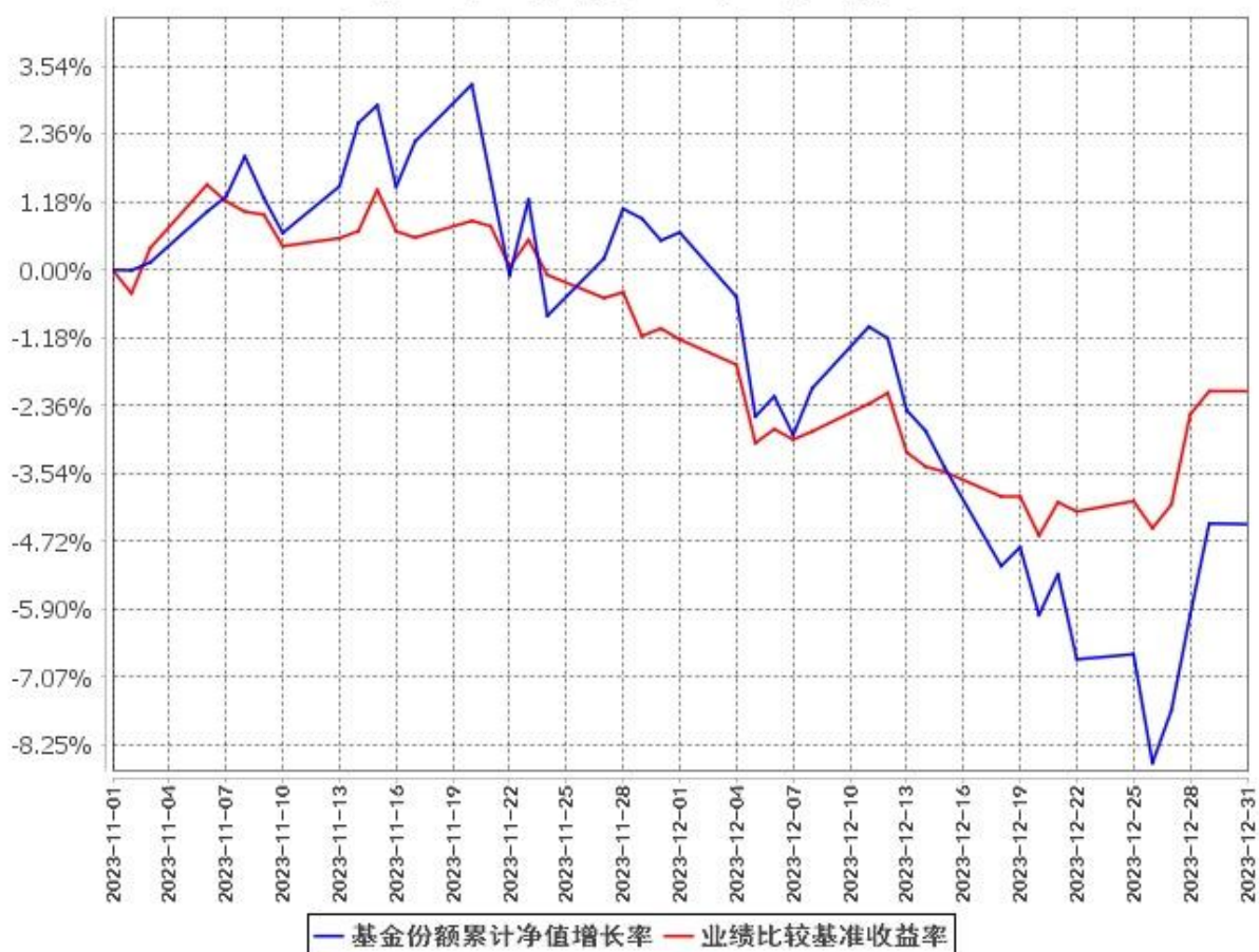
基金份额累计净值增长率与同期业绩比较基准收益率的历史走势对比图 (2023年11月1日至2023年12月31日)