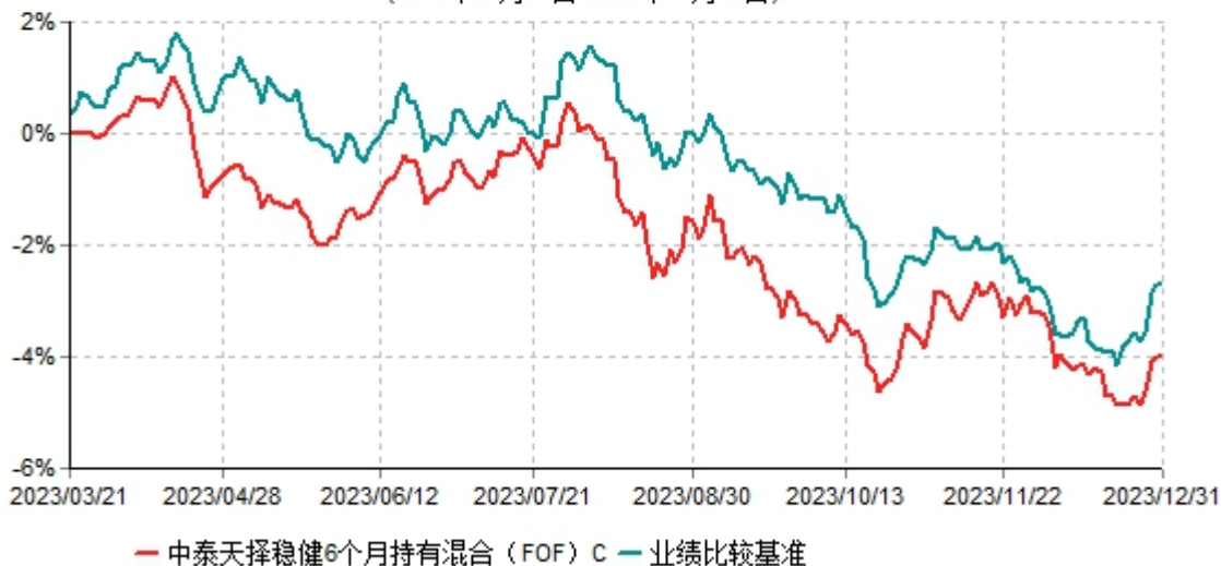
中泰天择稳健6个月持有混合（FOF）C累计净值增长率与业绩比较基准收益率历史走势对比图 (2023年03月21日-2023年12月31日)