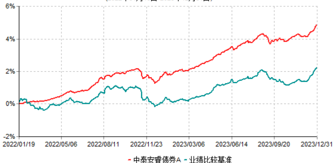
中泰安睿债券A累计净值增长率与业绩比较基准收益率历史走势对比图 (2022年01月19日-2023年12月31日)