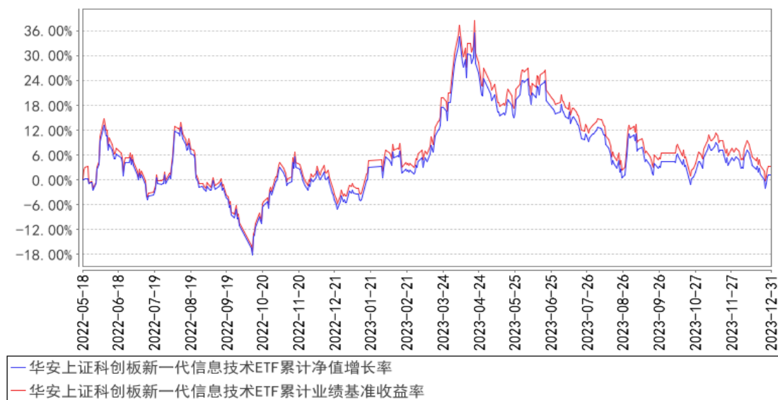
华安上证科创板新一代信息技术ETF累计净值增长率与同期业绩比较基准收益率的历史走势对比图