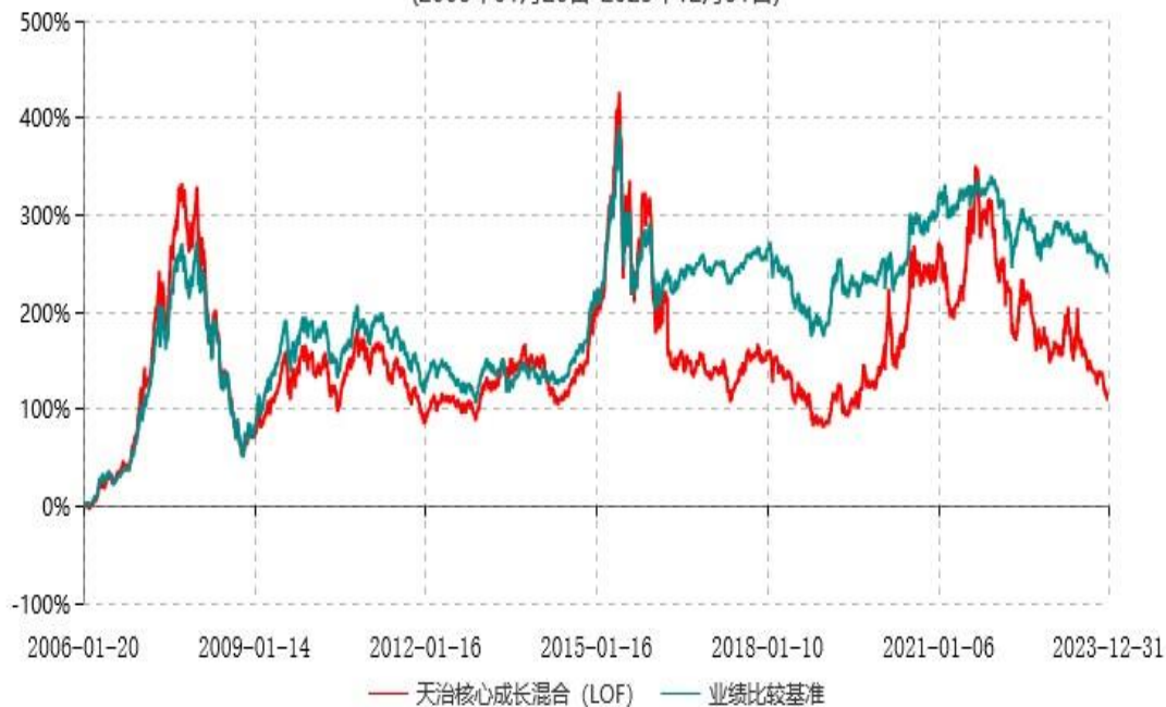
天治核心成长混合型证券投资基金（LOF）累计净值增长率与业绩比较基准收益率历史走势对比图 (2006年01月20日-2023年12月31日)