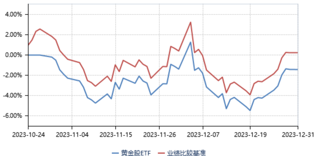
永赢中证沪深港黄金产业股票交易型开放式指数证券投资基金累计净值收益率与业绩比较基准收益率历史走势对比图 (2023年10月24日-2023年12月31日)