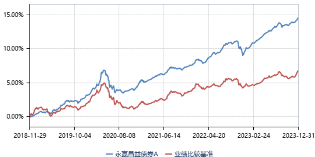
永赢昌益债券A累计净值收益率与业绩比较基准收益率历史走势对比图 (2018年11月29日-2023年12月31日)