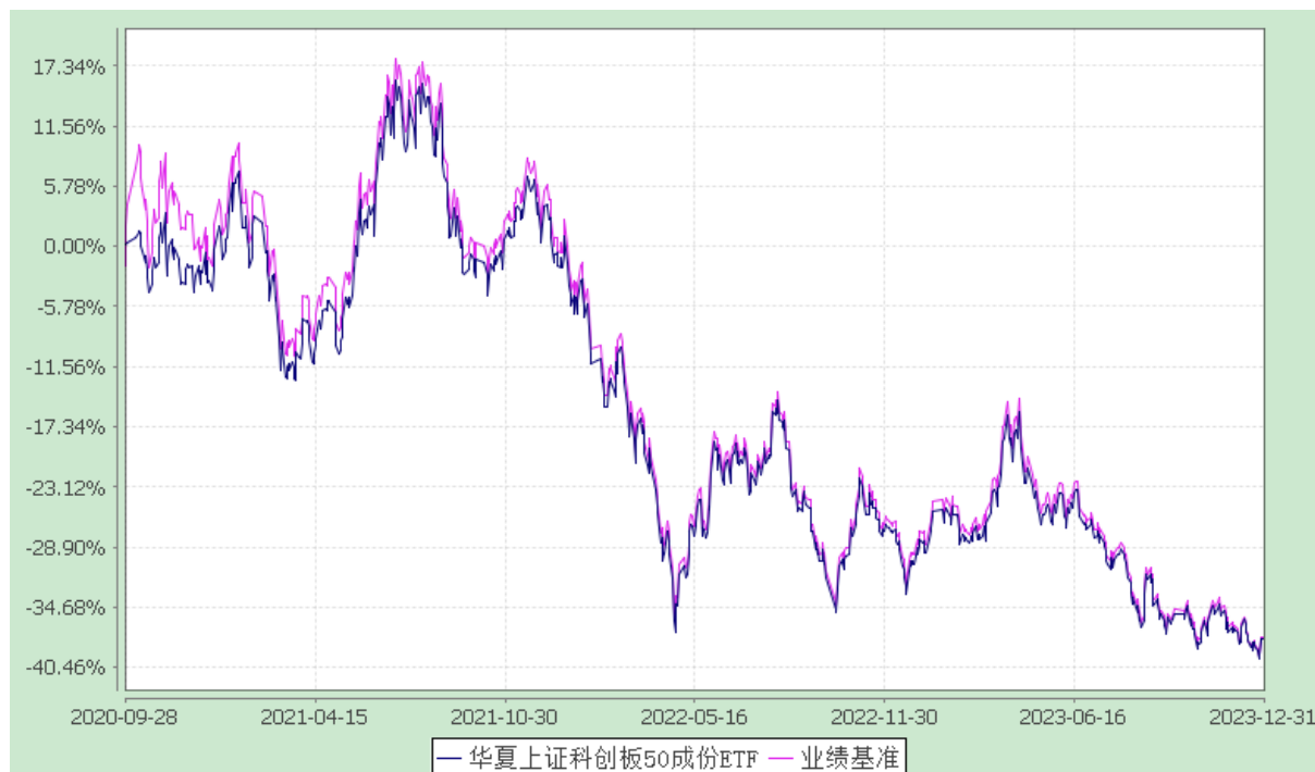
华夏上证科创板 50 成份交易型开放式指数证券投资基金 份额累计净值增长率与业绩比较基准收益率历史走势对比图 (2020 年 9 月 28 日至 2023 年 12 月 31 日)